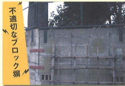
不適切なブロック塀

こんな症状があると、震災時に転倒や倒壊の恐れがあります。人が死傷したり、救急活動・物資供給の妨げになります。専門家に相談の上、早めの対策をしましょう。