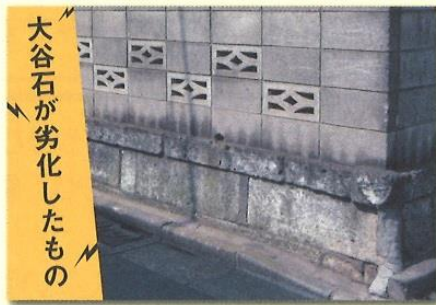
大谷石が劣化したもの