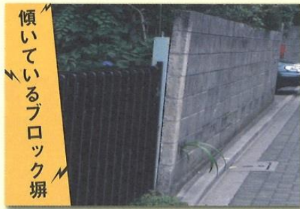
傾いているブロック塀